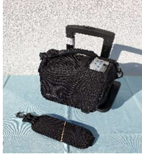
O2-Konzentrator mit Akku, Caddy und Tragetasche