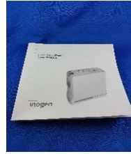
Anleitung / Informationen